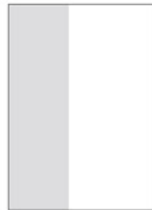
1/3 na výšku (5 mm na spad) 67x210 mm