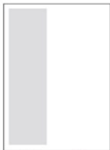
1/3 na výšku 61x284 mm