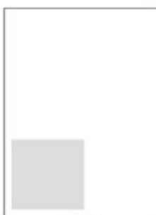
1/6 128x80 mm