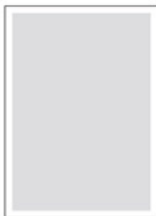
1/1 (zrcadlo) 194x284 mm