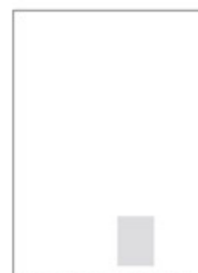
OKÉNKO V TV PROGRAMU 45X60 mm