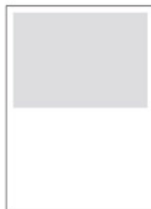
1/2 na šířku 194x140 mm